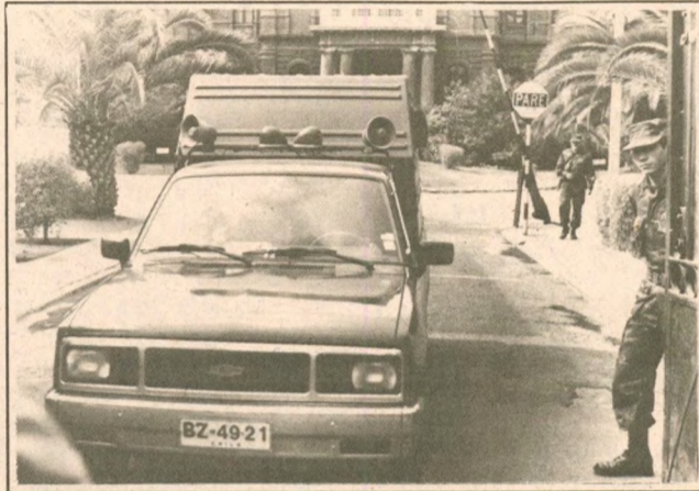
En este furgón habría sido trasladada la Mata Hari chilensis desde el COF hasta la fiscalía militar, ayer en la mañana

de La Cisterna. Ayer en la mañana, sin embargo, fuentes vinculadas al recinto carcelario negaron que la mujer haya pasado allí la noche.