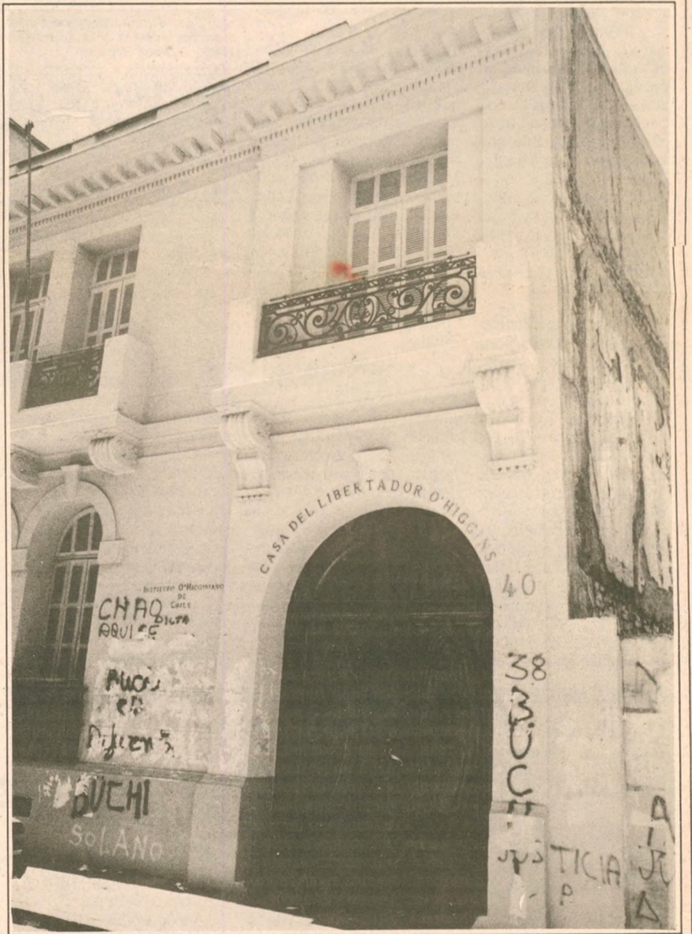
Calle Londres número 38, hoy número 40. Aquí se desarrolló una verdadera "escuela" de los agentes torturadores

El 18 de agosto, el semanario estadounidense Times afirma: "El terrorismo derechista de ambos lados de los Andes se confabuló en la desaparición de 119 ciudadanos